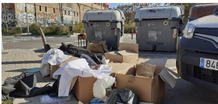
Foto 14. Ropa tirada fuera de lugar, en c/ Josep Pla//Marroc