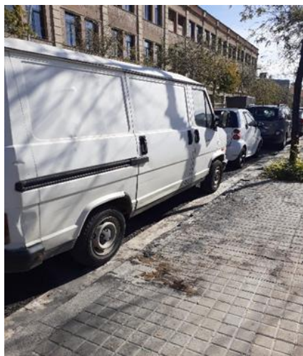
Foto 11: Los vehículos ocupan el lugar de los contenedores quemados

En cuanto a los contenedores quemados , se han reflejado sobre el mapa. En dos de los puntos de los contenedores quemados (Ca l'Illa y c/ Maresme) se tramitó la incidencia a través de la " Bústia ciutadana ", recibiendo la contestación de que se está llevando a cabo la reposición de los contenedores quemados en el barrio del Besòs-Maresme de estos últimos meses.