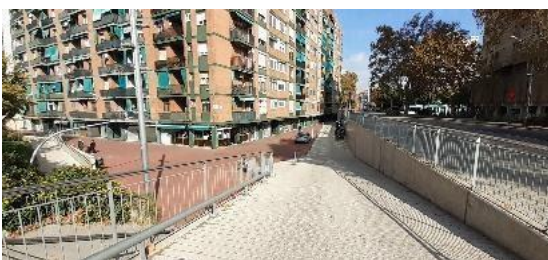
Foto 6: c/ Bernat Metge sin contenedores

Los establecimientos nos comunican su malestar por el poco civismo de algunos vecinos, dejando las bolsas de basura al lado de los contenedores de papel, cristal y envases y llenando la única papelera de la zona comunitaria, no llegando la mayoría al punto de recogida mecánica de la Gran Vía y, esto genera además plaga de ratas .