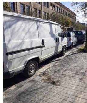
Foto 2: Los vehículos ocupan los antiguos contenedores quemados (c/Puigcerdà)