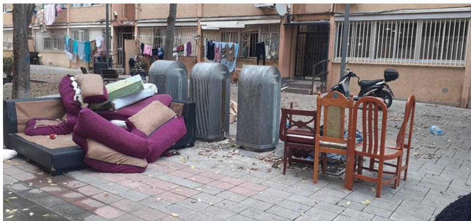
Foto 10: c/ de la Pau, un lunes. El día de recogida es el viernes

En el área comprendida entre c/ de Narbona y c/ de la Pau podemos observar residuos de todo tipo, incluso de muebles. El día de la toma de la imagen fue un lunes, y la recogida de muebles viejos en el barrio es el viernes.