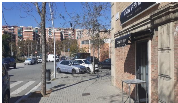
Foto 1: Contenedores de chaflanes de c/ Bolívia con c/ Puigcerdà se trasladaron a c/ Puigcerdà, quemados y no repuestos

“A veces, no puede tirar los residuos orgánicos ni de resto debido al alto volumen que existe en los contenedores más cercanos (c/Bolívia con c/Maresme, puntos frágiles).