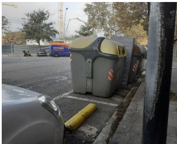
Foto 12: C/ Maresme/Venezuela, ausencia de contenedores(quemados)

"Aquesta acció està subvencionada pel Servei Públic d'Ocupació de Catalunya en el marc del Programa de suport als territoris amb majors necessitats de reequilibri territorial i social: Projecte Treball als Barris "