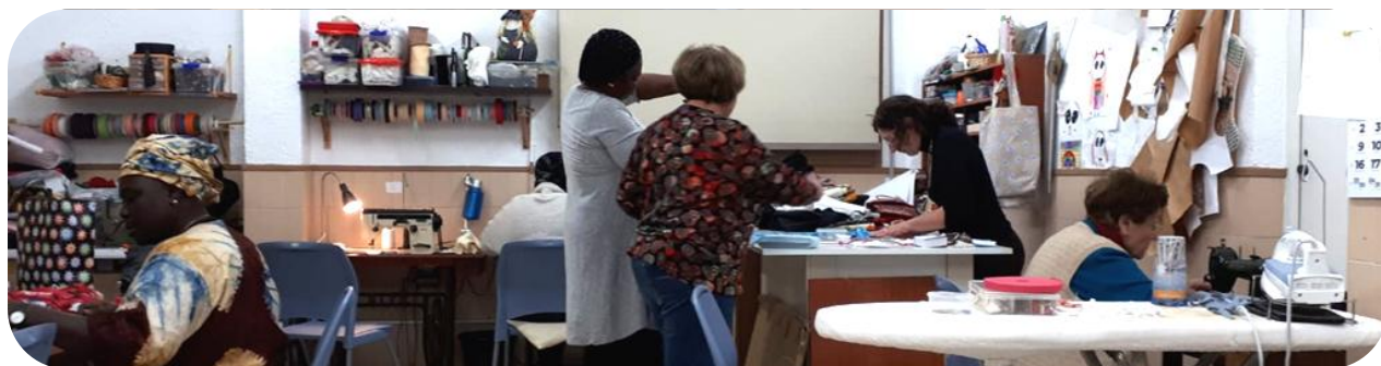
Taller de costura a l'Associació Àmbar Prim

Per a la gent treballadora el futur sempre serà difícil, com ho era abans. Però ara la forma de vida ha canviat i es viu millor. Abans amb 500 pessetes no arribaven, a fi de mes, només el lloguer era de 300. Ara passa el mateix però hi ha més ajuts i recursos. Abans la gent era molt pobra i es va notar una petita millora, amb feina gairebé per a tothom, però la crisi ens ha empobrit de nou. En quan a seguretat, els anys 80 van ser molt durs i ara sembla que es torna a reproduir la conflictivitat. Esperem que això canviï. Tants tècnics i tantes persones que estan actuant al barri sembla que tinguin aquesta pretensió però s'hauria de concretar en fets en lloc de tants projectes teòrics, o si no que ens deixin fer a veïns i veïnes. La fórmula està en la cooperació i el compromís entre tots amb voluntat de transformar el barri, tal i com passava abans.