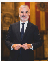
Jaume Collboni Cuadrado L'Alcalde de Barcelona